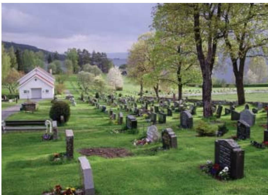
Kirkegården og Kirkestua ligger i nær kontakt med det vakre Randsfjord-landskapet.

Enda bedre blir det når kirka får nytt orgel. Dagens orgel er plagsomt og slitsomt.