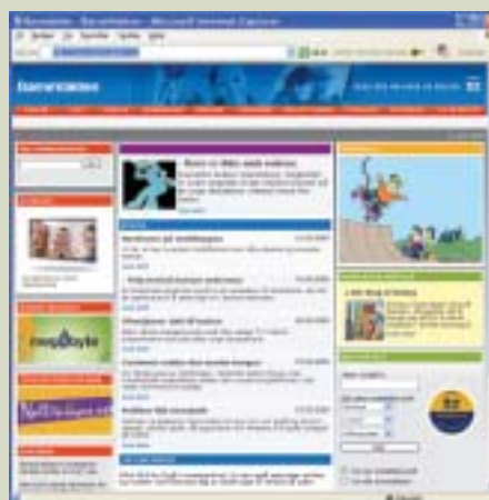
barnevakten.no – forsiden

Om barn og medier – spillanmeldelser, gode råd, ressurser, forskning, tips m.m