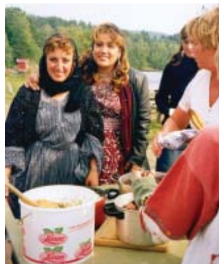
God mat gir fellesskap og glede.

Søndag 28.august kl.15.00 er det igjen tid for å møtes til en flerkulturell samling på Badstua ved Randsfjorden i Nordre Brandbu. Dette blir på andre siden av sommerferien, så sett ring rundt datoen på kalenderen og gled dere til en hyggelig sammenkomst på seinsommeren!