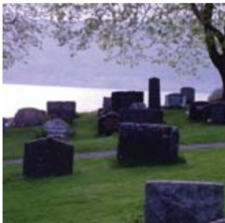
Kirkegården og fjorden: Også Vestsida hørte med til Nes i eldre tider.

barn blir viktige aktører. Kanskje blir det gammeldagse barneleker utenfor kirkegårdsmuren?