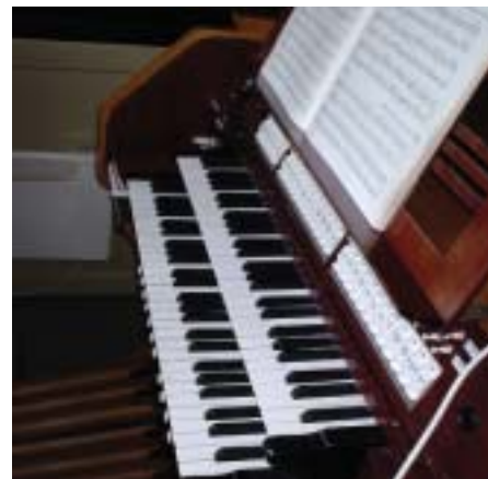
Nytt orgel er påkrevd