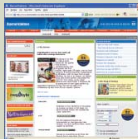
Spillanmeldelse «Fifa Street»