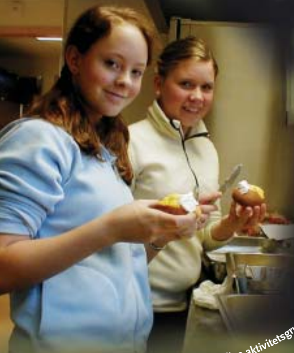
...gning. Her er det bakegruppa som er i s...

På konf.weekend kan man velge forskjellige aktivitetsgrupper.