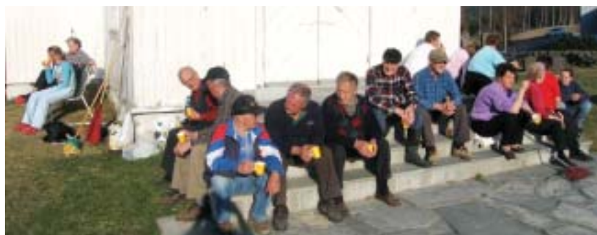
Pause og kaffe for dugnadsgjengen ved Sørum kirke

Vi vil takke bygdefolket for flott dugnadsinnsats på kirkegårdene i vår. Uten deres hjelp hadde ikke kirkegårdene sett så fine ut til 17. mai.