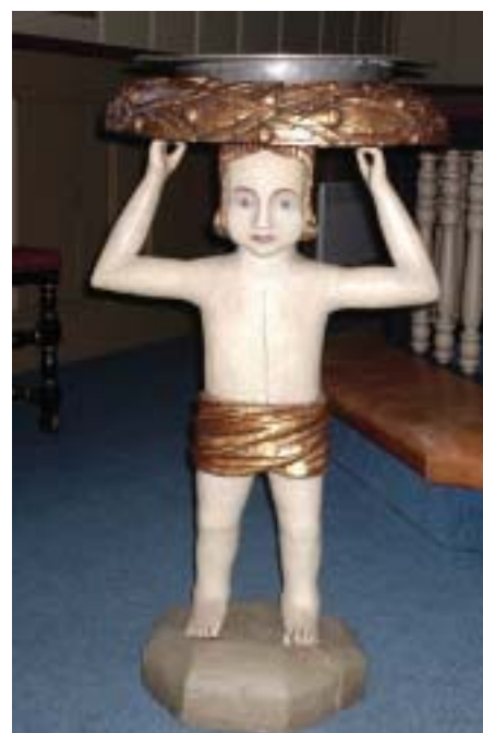
Døpefonten i Nes kirke