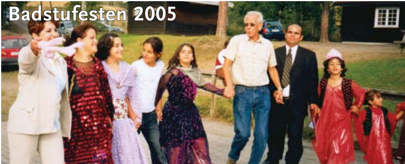
Fellesskap og glede kan uttrykkes på mange måter. Her prøver soknediakonen fra Gran seg, sammen med venner, på kurdisk folkedans