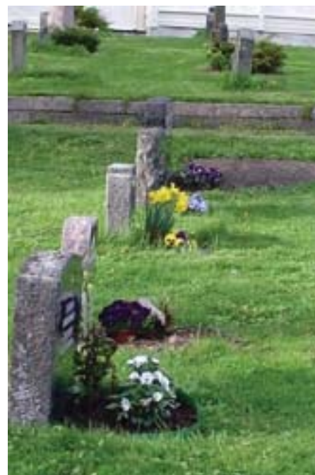
Velstelte graver på Nes kirkegård